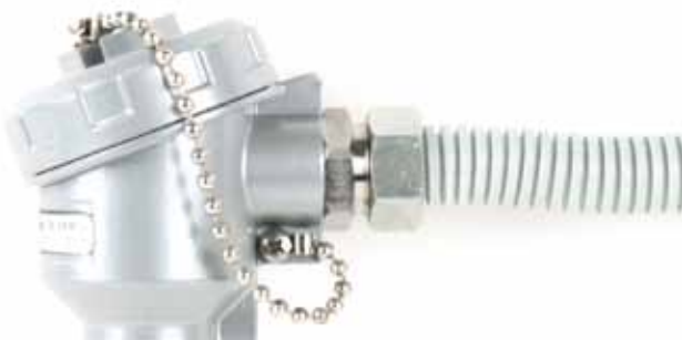
Кабельный ввод под пластиковый рукав серии КВП

Для удобства электрического подключения к процессу серия АИР-10Н оснащается широким спектром разъемов и кабельных вводов. Данные разъемы и кабельные вводы обеспечивают надежное, виброустойчивое и герметичное подключение кабеля к клеммной головке.