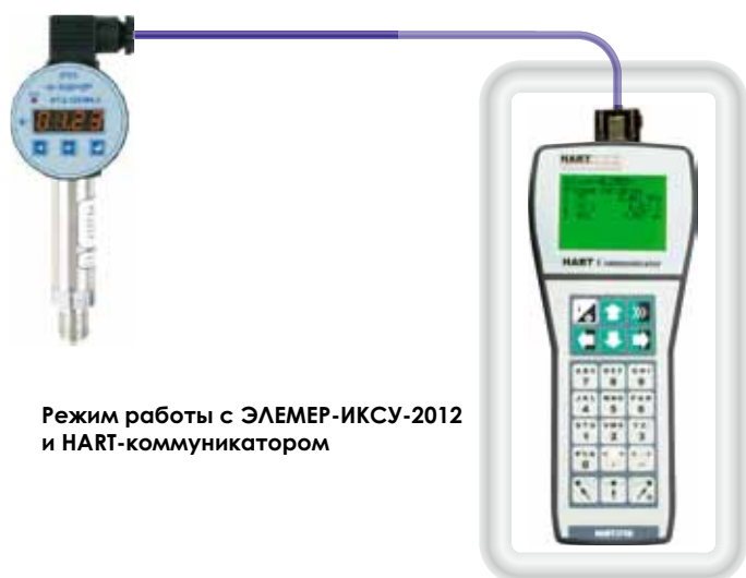
Режим работы с ЭЛЕМЕР-ИКСУ-2012 и HART-коммуникатором

Выбор конкретного поддиапазона из 8-ми у АИР-10Н и изменение других параметров конфигурации датчика, может производиться средствами HART-коммуникации: с помощью персонального компьютера и модема или HART-коммуникатора.