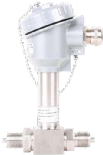
Корпус АГ-14 с клемной головкой из алюминиевого сплава