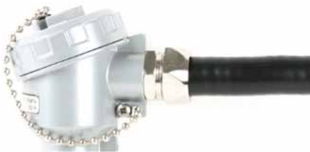
Кабельный ввод под металлорукав серии КВН