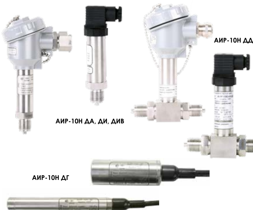
AIP-10H ДА, ДИ, ДИВ