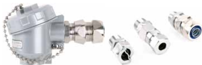
Исполнение Ex, Exd