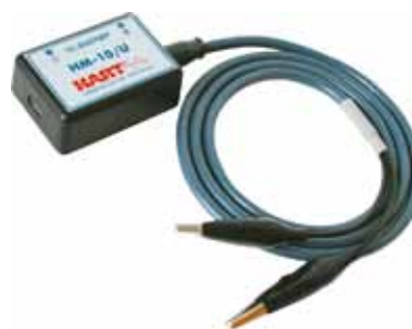
HART-модем HM-10U для работы с ПК

HART-коммуникаторы поддерживают список «универсальных» команд для всех типов датчиков с протоколом HART: перенастройка диапазона и единиц измерения, демпфирование, подстройка «нуля», смена сетевого адреса и других.