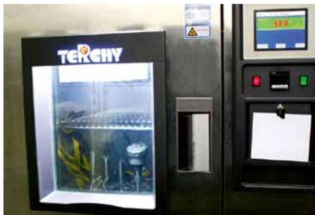
Калибровка в климатических камерах от -60 до +70 °C

Сегодня область применения датчиков давления AIP-10H охватывает все отрасли промышленности — водоочистку и водоподготовку, химическую, нефтехимическую, нефтеперерабатывающую, транспортировку энергоносителей, энергетику. Благодаря широкому температурному диапазону — -60...+70 °C и высокой степени защиты от пыли и влаги (IP67) датчики AIP-10H можно эксплуатировать в самых жестких климатических условиях на открытых технологических площадках без дополнительного обогрева или укрытия.