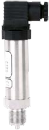
Корпус НГ-06 с разъемом GSP